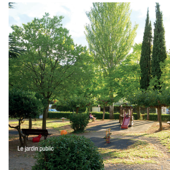
Le jardin public

Les Délices de Taradeau : 06 63 24 93 18