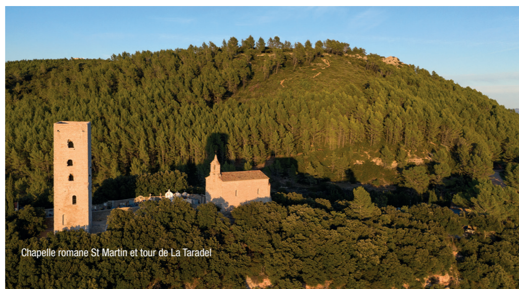
Chapelle romane St Martin et tour de La Taradel